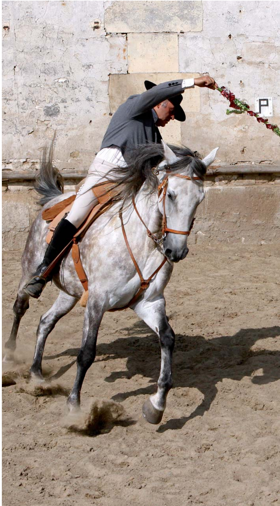
||||| L'ENTRAÎNEMENT du cheval de tauromachie (la tourinha ).