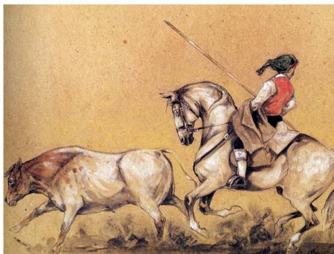
(dessins de Marine Oussedik)

Par Carlos PEREIRA Université Paris III Sorbonne Nouvelle CREPAL – Avril 2007 Société d'Ethnozootechnie